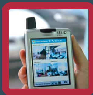
Visualizzazione delle telecamere da palmare