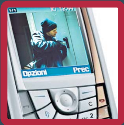
Videomessaggi di allarme direttamente su telefono GSM