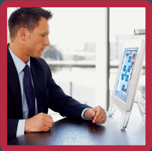
Verifica remota del sistema tramite ADSL