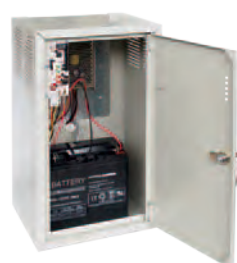
Gruppo di alimentazione con sportello aperto. N.B. Batteria non fornita