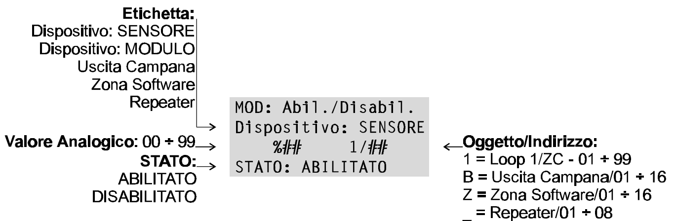
Figura 4 Schermata per l'Abilitazione/Disabilitazione dei Dispositivi.

DI SPOSI TI VI LOOP1 Di sposi ti vo non i n confi gurazi one su LOOP 1