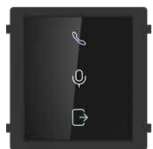
DS-KD-IN Modulo Sinottico di Stato