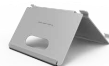
DS-KAB8350 Supporto da tavolo