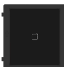
DS-KD-M Modulo Lettore Tessere Mifare