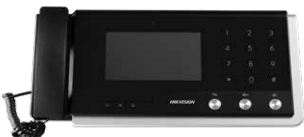
DS-KM8301 Centralino di Portineria