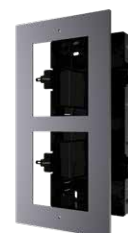
DS-KD-ACF2 Cornice 2 moduli