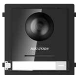
DS-KD8003-IME1 Unità Principale