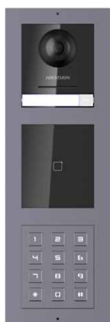
Postazione esterna modulare