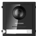
DS-KD8003-IME2 Unità Principale