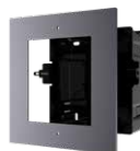
DS-KD-ACF1 Cornice 1 modulo