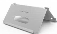
DS-KAB8X20 Supporto da tavolo