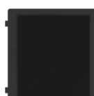
DS-KD-BK Modulo Cieco