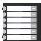
DS-KD-KK Modulo Pulsantiera