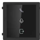
Sinottico di Stato