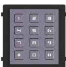
DS-KD-KP Modulo Tastiera