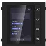
DS-KD-DIS Modulo Display LCD