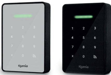
KS12100031.302 - ergo-X nero KS12100031.303 - ergo-X grigio