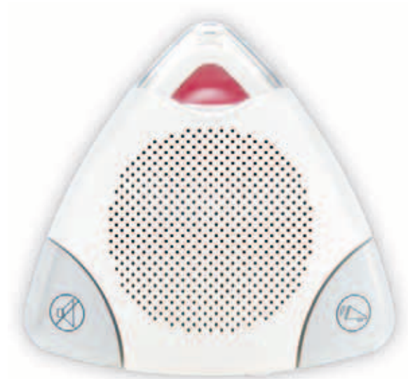
DGP-SUB1 (cod. PXDL SS1)