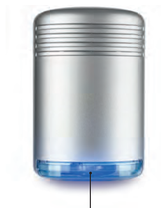
Nuovo LED BLU con funzione di luce di cortesia New BLUE LED for courtesy-light function

Supplemento per colorazioni personalizzate (min. 50 pz.) Costi di realizzazione da calcolare a parte Extra cost for customized colours (50 pcs. min.) Costs calculated separately